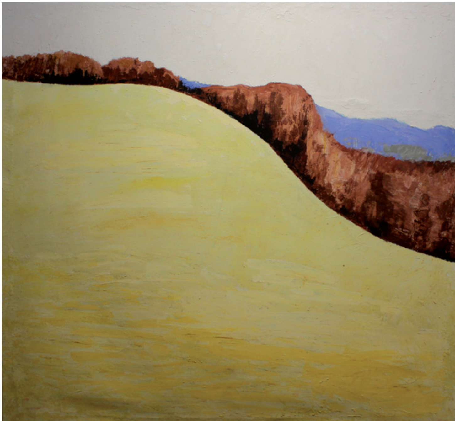
Georg Münchbach; Landwassereckraum; Öl auf Leinwand, 130 cm x 140 cm

Filmpremiere am 29.03.2021: „Georg Münchbach. Was bleibt, ist die Kunst. Innenansichten eines Künstlerlebens.“