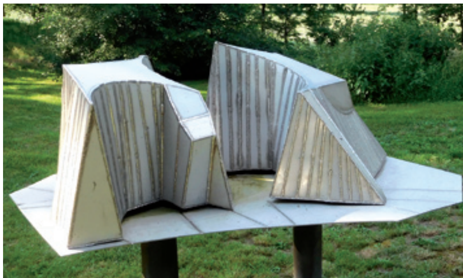
Georg Münchbach; Waldränder ; 2008; VA Stahl