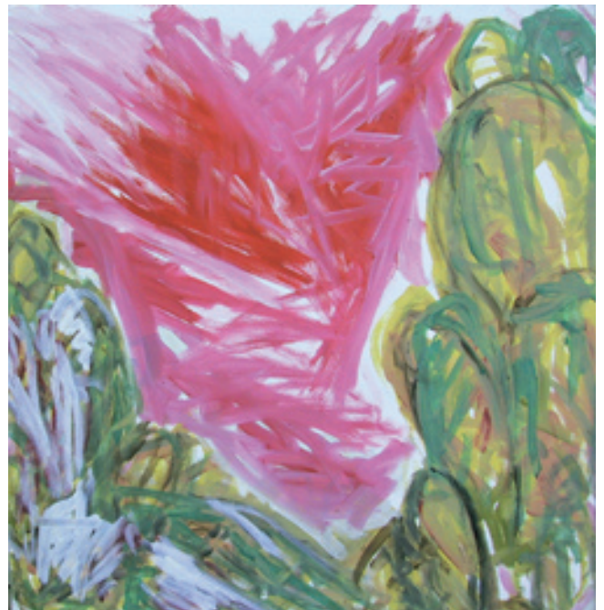
Georg Münchbach; Wachholderraum ; 2005, Öl auf Leinwand, 140 cm x 135 cm © Falk Münchbach

Der Brunnen am Schnellenmarkt Uelzen, diese hoch aufgerichtete Säule, einerseits eine Hommage an die Faszination des Bildhauers an Megalithkultur, andererseits Bezug zu dem mittelalterlichen Marktplatz, auf dem einst so genannte „Schnellen“, also Töpfe und Gefäße feilgeboten wurden. Münchbachs moderne „Venus“, römische Göttin der Liebe und Schönheit, die sich zum Himmel streckt in ihrer hohen Bronzeplastik, ist ein Kleinod im Stadtgarten Uelzens, das Verbindung schafft. Auch in der griechischen Mythologie als heller Planet und Göttin der Liebe verehrt, sahen alte Kulturen des Mittleren Ostens in der Venus Ishtar allerdings auch eine Göttin des Kampfes. Die Uelzener Versicherung förderte immer wieder Projekte des Bildhauers und Malers Georg Münchbach im Sinne von