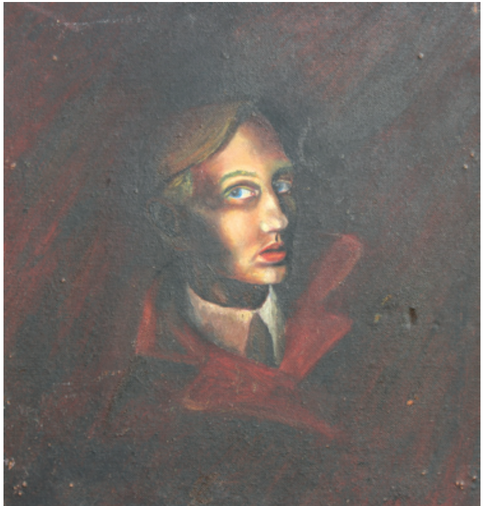
Georg Münchbach; Selbstporträt; Öl auf Hartfaser; 1943, 55 cm x 50 cm