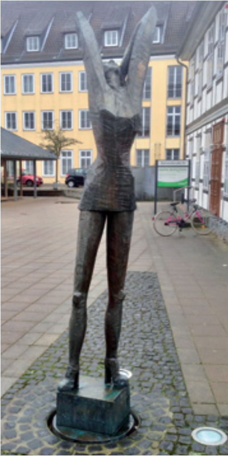
Georg Münchbach; Venus; Bronze, 2000, Höhe: 255 cm © Falk Münchbach

„Wirtschaft fördert Kunst“. Die Zeiten, in denen dieser Satz ausschließlich in dieser Richtung gedacht wurde, sind aufgrund der Forschungsgruppe um Ursula Bertram und weiteren Wissenschaftlern aus der Wirtschaft und anderen Disziplinen mittlerweile zu einem bemerkenswerten Faktor eines Nach- und Wei-