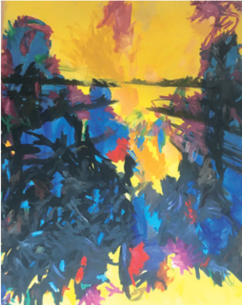
Georg Münchbach; Heideland ; Öl auf Leinwand; 1984, 14,5 cm x 18 cm © Falk Münchbach

ers. Münchbach hat eine ganze Reihe solcher faszinierender Landschaftsbilder geschaffen, dieses mit Bezug und in der Rückschau zu den Schwarzwälder Wurzeln.