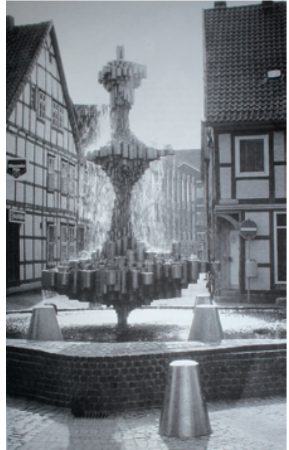
Georg Münchbach; Brunnen auf mittelalterlichem Topfmarktplatz Schnellenmarkt, Uelzen; VA Stahl, 1980, Höhe: 5,5 Meter

„Was wirkliche Bilder sind, registrieren wir oft erst nach einer längeren Zeit der Erinnerung“