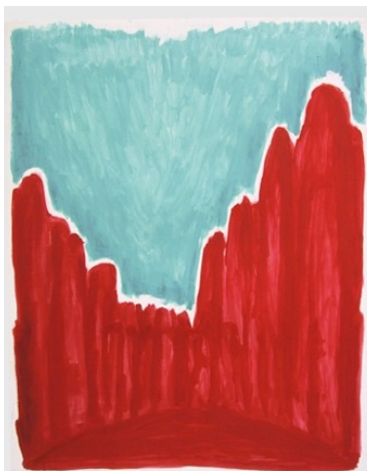
Gefilde; (Raum und Materie gehören zusammen wie Yin und Yan)

Raum erleben zwischen Dingen; Abstände kann man spüren - zwischen uns und anderen Menschen oder Gegenständen.