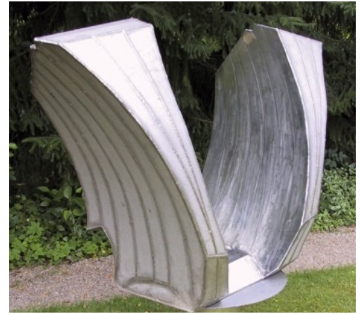
Die Buttschlucht; VA Stahl