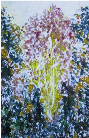
Eindringende Energie. Unsichtbare Atom- bewegungen sind auch da, wo scheinbar nichts ist